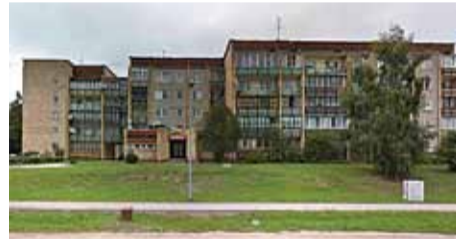
No 1990. gada jau kā Stopiņu pagasta Ulbrokas tautas bibliotēka atrodas Institūta ielā 17, Ulbrokā (ēkas attēls fiksēts 2015. gadā).