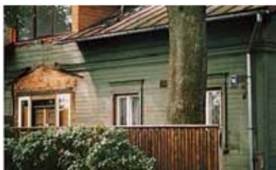
1947. gadā Stopiņu ciema Dreiliņu bibliotēka mājvietu rod ciema padomes ēkā „Tālavas”, Kaivas ielā 14 (ēkas attēls fiksēts 2004. gada pavasarī).