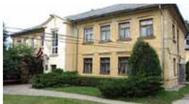
1972. gadā Rīgas rajona Stopiņu ciema Dreiliņu bibliotēka tiek pārvietota uz ciema padomes ēku Institūta ielā 14, Ulbrokā (ēkas attēls fiksēts 2015. gada vasarā).