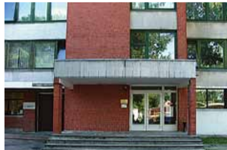
Tagadējā Ulbrokas bibliotēka atrodas Institūta ielā 1, Ulbrokas Zinātnes centra 2. stāvā.