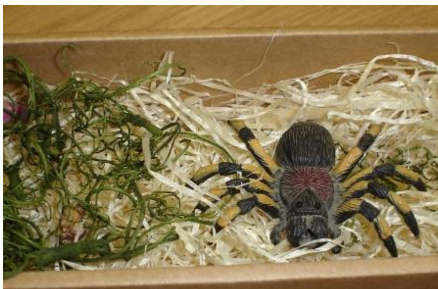
Tas ir mūsu Tarantuls

Secinājām, ka esam pavadījuši jauku vakaru!