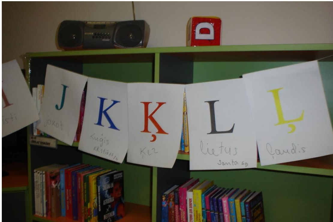
Mūsu kopīgā darba fragments